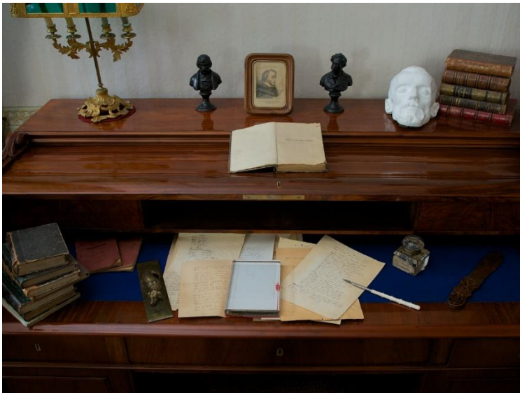
Рабочий стол Н.А. Некрасова.