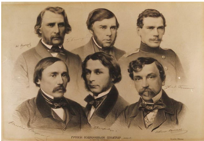
В.Тимм. Современные русские писатели. 1857 г. Литография вышла в свет в 1857 году в издании "Русский художественный листок В. Тимма".