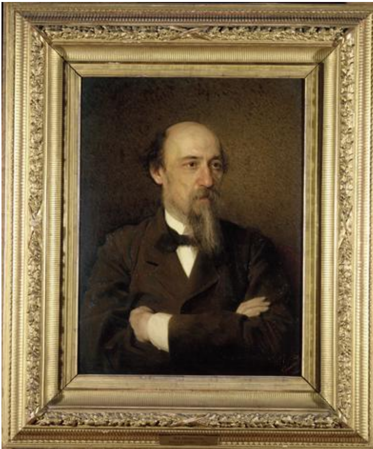
И.И. Крамской. Портрет Н.А. Некрасова. 1877 г.

Портрет Некрасова Крамскому заказали, когда поэт был уже тяжело болен и не мог вынести долгой работы над портретом. Натурщиком он мог быть всего 10-15 минут в день, что для портрета ничтожно мало, и единственной поддержкой была старая фотография, выданная художнику родственниками больного. Совмещая письмо с натуры и письмо с фотографии, Крамской создал один из своих типичных портретов, который для себя возвел в ранг отдельного жанра.