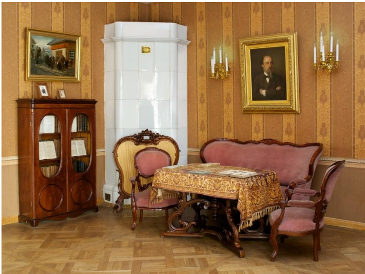
Фрагмент столовой с портретом Н.А. Некрасова.