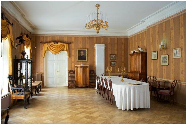
Фрагмент столовой с портретом И.С. Тургенева.