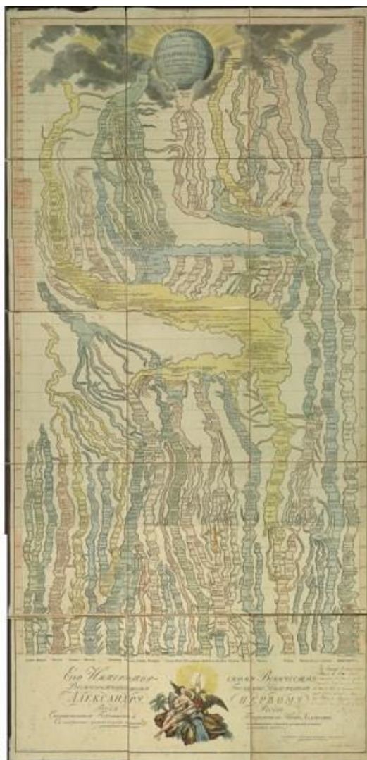
Карта «Река Времен» (СПб., 1805). Составители Ф. Штрасс, А. Варенцов