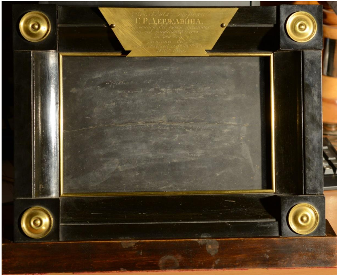
Грифельная доска Г.Р. Державина с его последним стихотворением (Хранится в Рукописном отделе Российской национальной библиотеки)