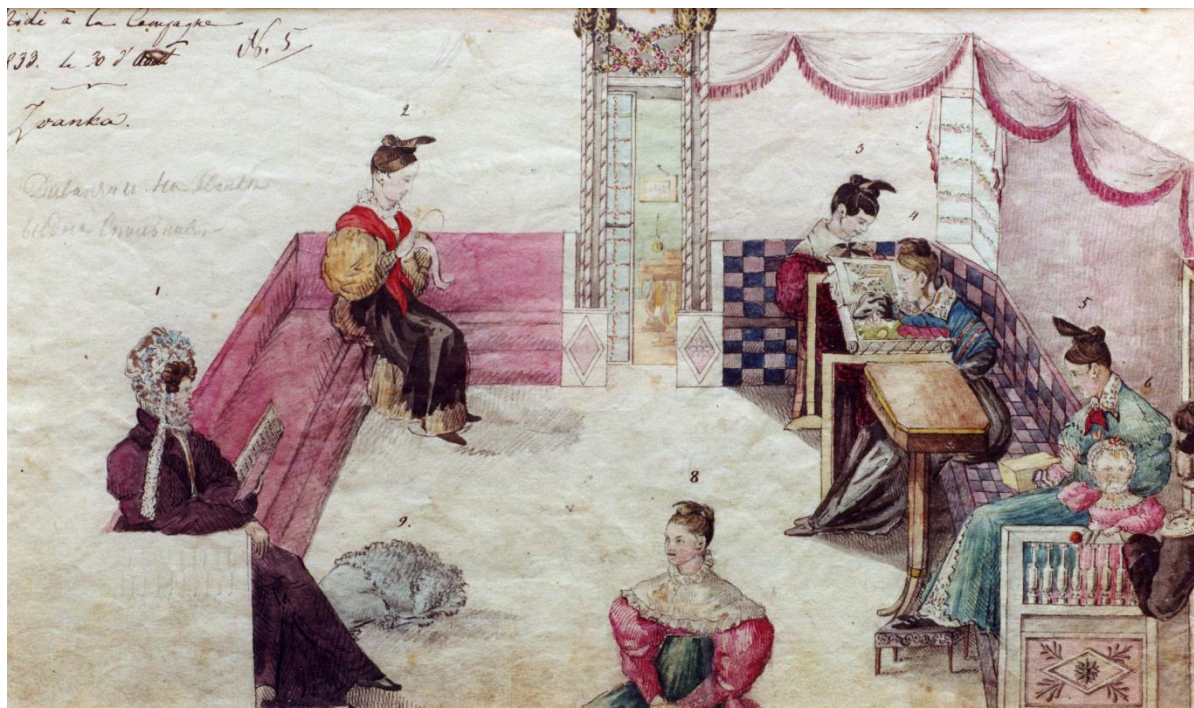
А.П. Кожевников. Диванчик в Званке. 1833. Бумага, акварель