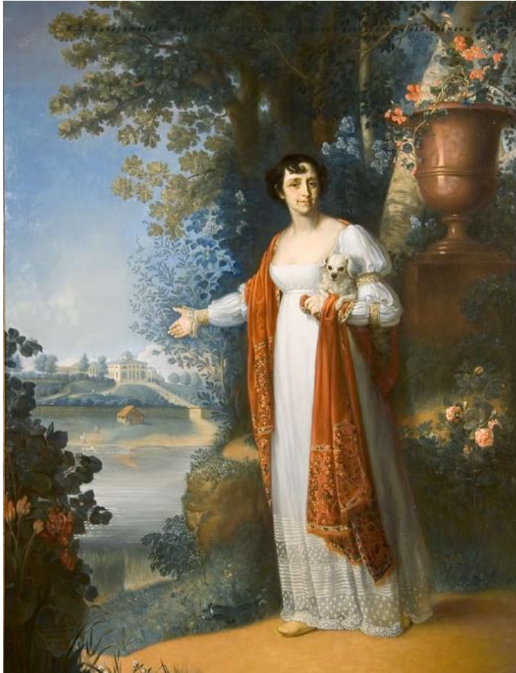
Боровиковский В.Л. Портрет Д.А. Державиной на фоне Званки. 1813. Холст, масло. Копия. Ориг. в ГТГ.

Усадебный дом в имении Званка не сохранился, но в 1840-е годы соседом Державиных А.П. Кожевниковым были сделаны цветные поэтажные планы дома с перечнем мебели, стоявшей в каждой комнате. Благодаря этим документам мы можем не только представить, как выглядели кабинет поэта, гостиная, но и попытаться реконструировать их. Стихотворение Державина «Жизнь Званская» подробно рассказывает о событиях, происходивших в этих интерьерах дома. Планы представлены в экспозиции Музея-усадьбы Г.Р. Державина.