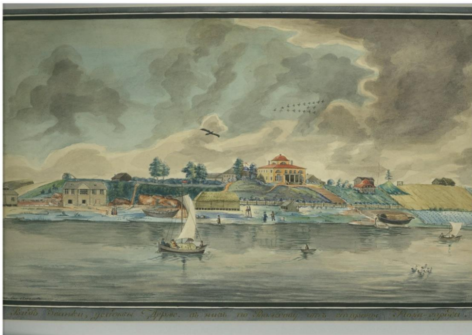
Аврамов Е.М. Вид Званки. 1807. Акварель. Копия. Ориг. ИРЛИ РАН